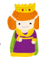
MAFALDA a rainha