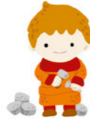
PEDRO o canteiro