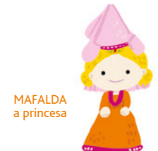
MAFALDA a princesa